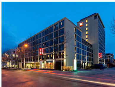
Ibis Parkstadt Schwabing Lyonel-Feiniger-Str. 20, 80807 München EZ 92,00 € / DZ 103,00 € incl. Frühstück.

Von den Hotels zum Olympiastadion und zurück wird ein Shuttledienst eingerichtet.