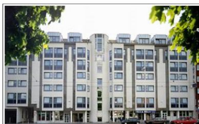
Hotel Europa Dachauer Str. 115, 80335 München EZ 119,00 € / DZ 139,00 € incl. Frühstück.

Ab München Hbf U4 Arbellapark > Odeonsplatz U3 Moosach > Münchener Freiheit Tram 23 Schwabing Nord > Domagkstr. Fußweg 380m