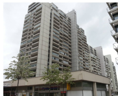
Four Points by Sheraton München Olympiapark, Helene-Mayer-Ring 12, 80809 München EZ 109,00 € / DZ 129,00 € incl. Frühstück.

Ab München Hbf U2 Feldmoching > Frankfurter Ring StadtBus 177 Studentenstadt > Ingostädter Str. Fußweg 500m oder U2 Feldmoching > Scheidplatz StadtBus 140 Kieferngarten > Domagkstr. Fußweg 280m